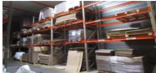
Lot n°97 - Un stock de matière première.